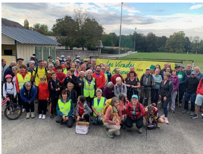
Une partie des participants