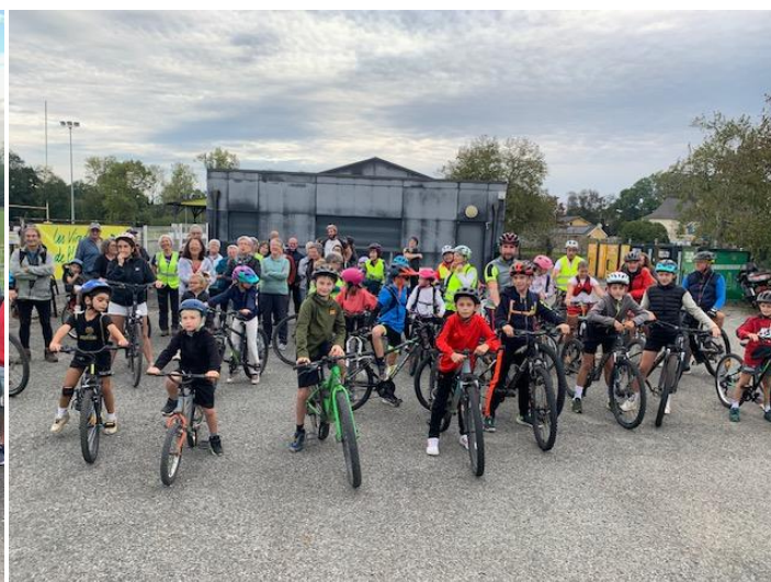
Départ de la rando famille